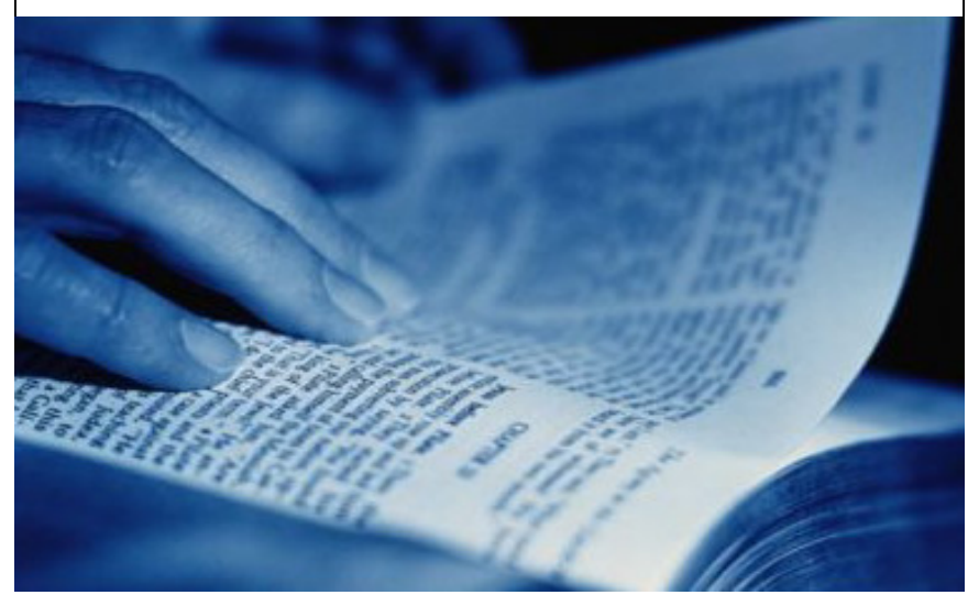
St Mary's Orthodox Church of Rockland