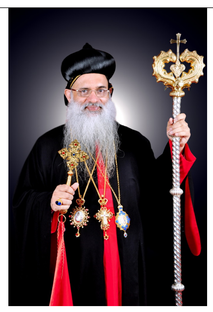
CATHOLICATE PALACE KOTTAYAM 686 038 KERALA, INDIA

TEL: 011 91 481 570569, 578234, 578499 FAX: 011-91-481-570569